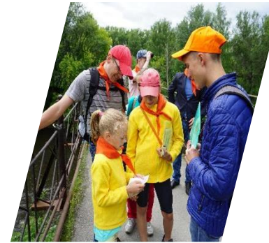
Мосты Тагила, Нижний Тагил, 2019 г.