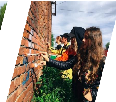
Цветущий город Качканар, 2019 г.