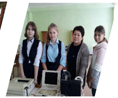
Музей XX века Междуреченск, 2019 г.