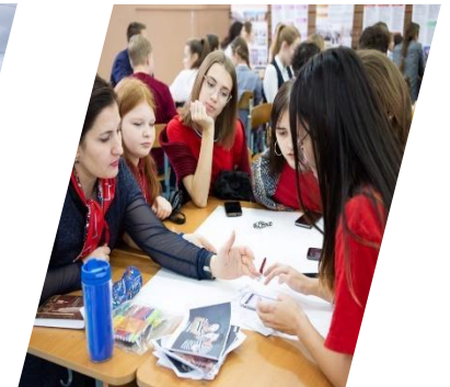
Art-chill, Глазов, 2019 г.