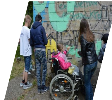
Рисуют все! Нижний Тагил, 2019 г.